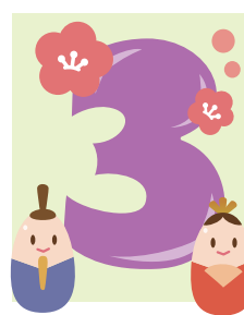
◎トランポリン強化月間