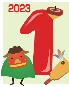
◎トランポリン強化月間